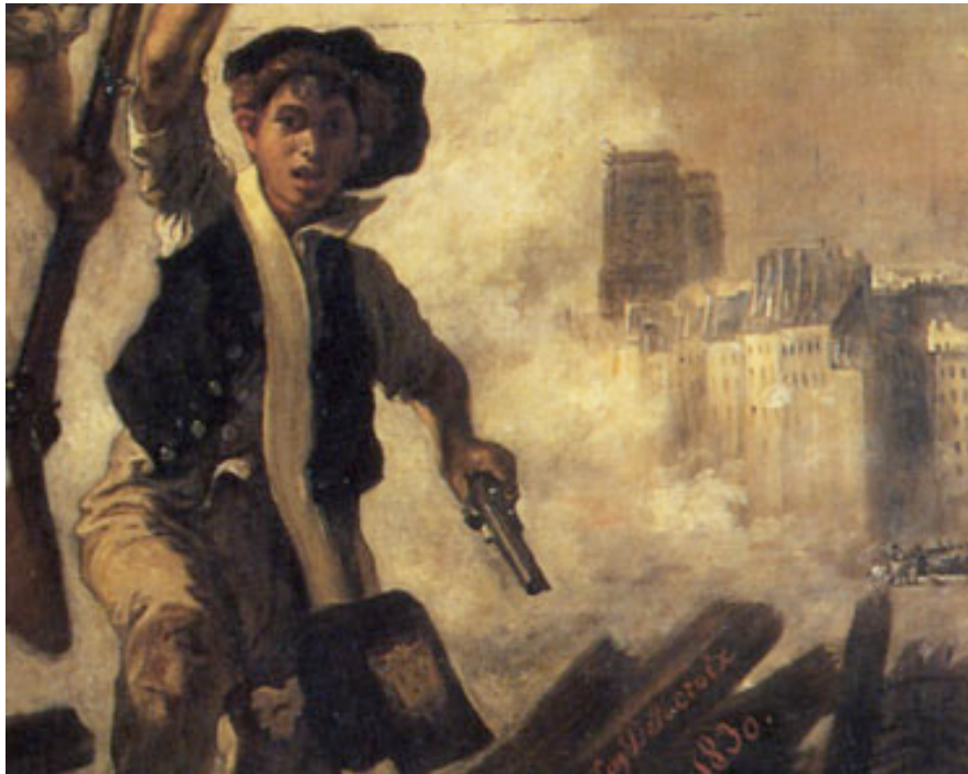
La liberté guidant le peuple (détail), Eugène Delacroix, 1830