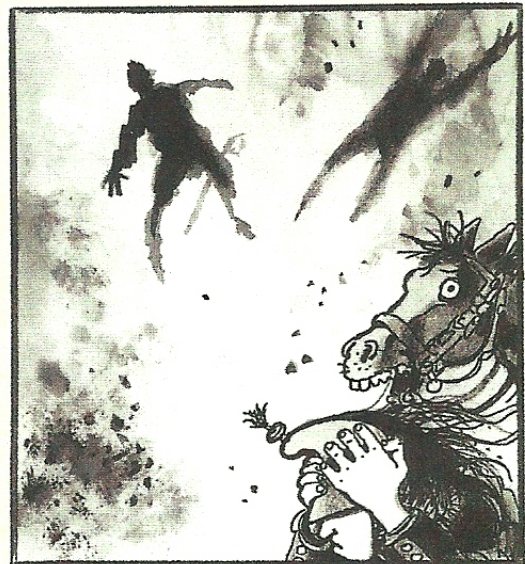
Jacques TARDI, illustrations pour Voyage au bout de la nuit , de Louis-Ferdinand CÉLINE, © Éditions Gallimard/Fonds Futuropolis, 1988.