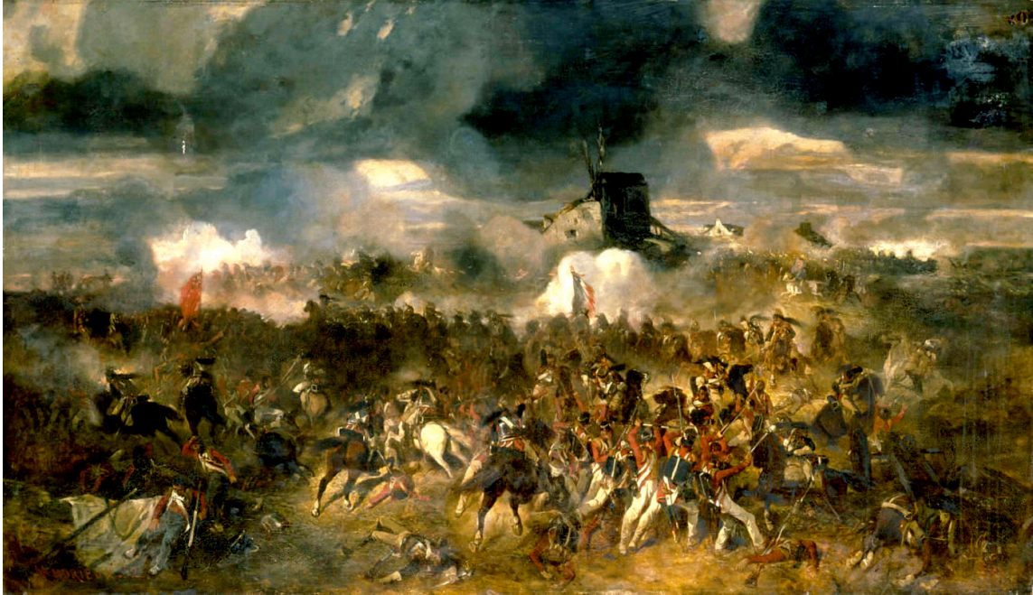
La bataille de Waterloo, le 18 juin 1815, Clément-Auguste Andrieux, 1852