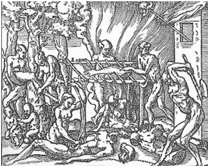
Illustration d'un rituel cannibale pour la Cosmographie universelle d'André Thevet, 1575