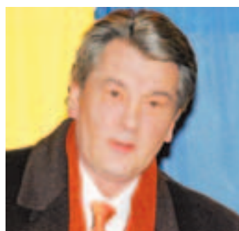
Le président Iouchtchenko, désavoué.

occidentaux de la « révolution orange », Viktor Iouchtchenko et Ioulia Timochenko, se sont dits prêts, hier soir, à réunifier leurs rangs. Page 4 et notre éditorial page 23